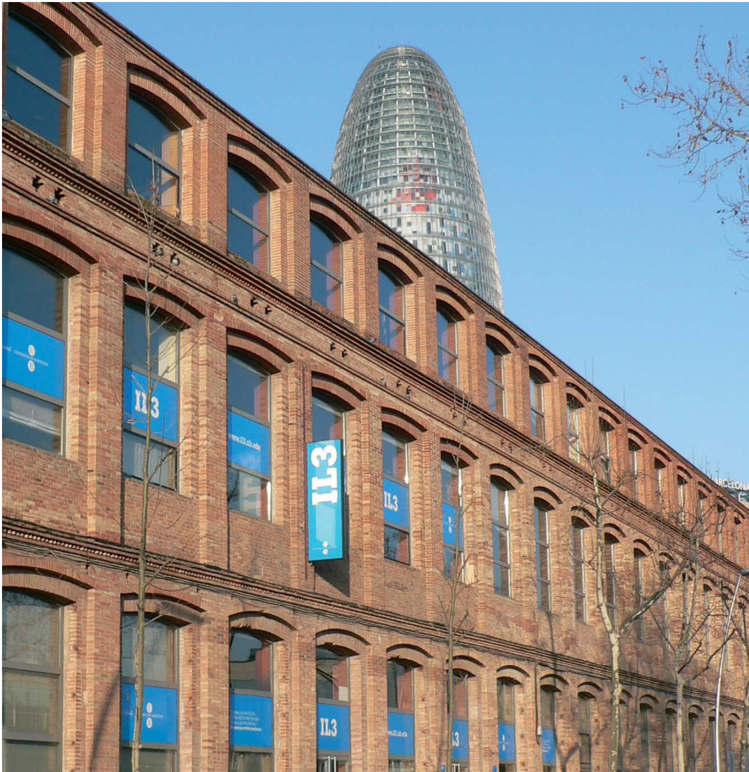
Sede del IL3-UB en Barcelona

“ El Instituto de Formación Contínua de la Universidad de Barcelona -IL3- cuenta con el prestigio académico y experiencia docente de profesores, investigadores y expertos de los diferentes Departamentos de la Universidad de Barcelona y con la participación de destacados profesionales del mundo empresarial y económico. ”